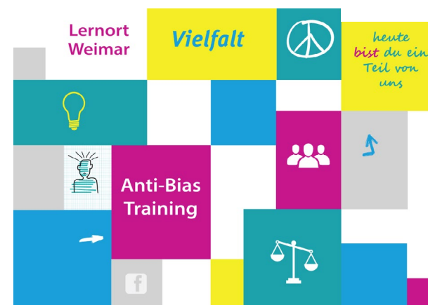
Titel | Bild: Edward Mullen Innen Bild: Annette Kübler